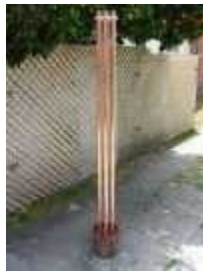
Rompe Nubes de Orgónito (El Rompe Químicos)