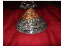
Cono de Orgónito