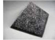
Pirámide de Orgónito (La Santa Granada)